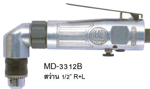
MD-3312B ส่วน 1/2" R+L