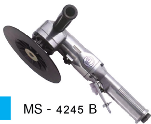
MS - 4245 B