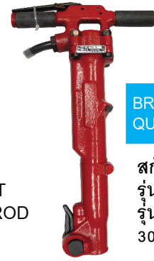
BREAKER LATCH QUICK CHANGE TYPE

หัวเจาะคอนกรีต CARR BIT & CROSS BIT ใช้กับก้านเจาะ TAPER ROD สกัดหินภูเขา รุ่นสองมือ รุ่น TJ 15, 20