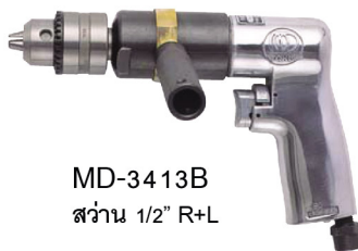
MD-3413B ส่วน 1/2" R+L