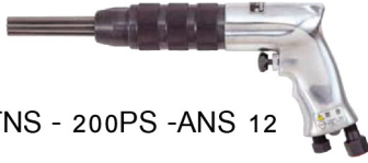
TNS - 200PS -ANS 12