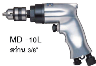
MD -10L ส่วน 3/8"