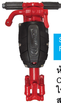
SINKER ROCK DRILL ROTARY HAMMERS

สกัดคอนกรีตถนน รุ่นสองมือ รุ่น TCB 130B, 200, 300