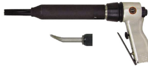
TNS - 204 PS -ANS 13

FLUX CHIPPERS แกะสลักหิน/รูปภาพ/ตัวหนังสือ