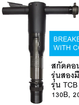
BREAKER RETAINER WITH COIL SPRING

สกัดคอนกรีตถนน รุ่นสองมือ รุ่น TCB 130B, 200, 300