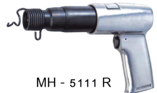
MH - 5111 R