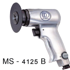
MS - 4125 B