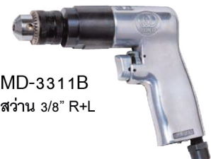
MD-3311B ส่วน 3/8" R+L