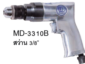
MD-3310B ส่วน 3/8"