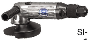
SI-2500 เครื่องขัดไฟเบอร์ 4" แบบมือปิด