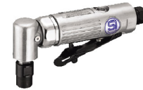
SI-2006 s เครื่องเจียร รุ่นหัวงอ