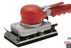
SI-3005 เครื่องขัดแบบสัน รุ่นมือถือ 90 X 165 มิล.