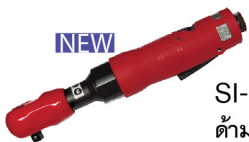
SI-1340 B ต้ามฟรี 3/8" หุ้มยาง รุ่นงานหนัก ลมออกหน้า