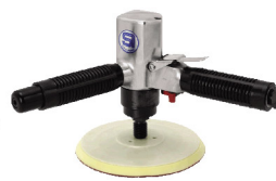
SI-2405 เครื่องขัดเงาสีรถยนต์ 6" (รุ่นเบา)