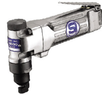
SI-4600 ไดร์ไพล์มตัด 1.6 มม. Air Nibbler