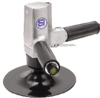
SI-2300 เครื่องขัดกระดาษทราย 7"