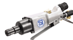
SI-1370D ไขควงลมขันสกรู เกลียวปลั๊อย 8-10 มม. รุ่นงานหนัก