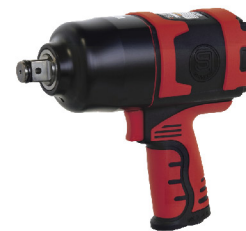
SI-1550 บ็อกลม 3/4" รุ่นปืน ระบบ Twin Hammer