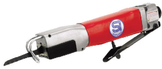
SI-4700 B จิ๊กซอว์ลม Air Saw