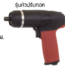
SI-1170 ไขควงลมขันสกรู เกลียวปลั๊อย 8-10 มม.