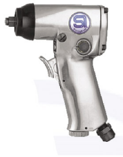
SI-1355 บ็อกลม 3/8" รุ่นปืน ระบบ Single Hammer