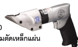
SI-4500 กรรไกรลมตัดเหล็กแผ่น 1.6 mm Sheet Metal Shear