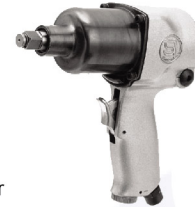
SI-1420 T บ็อกลม 1/2" รุ่นปืนงานหนัก ระบบ Twin Hammer