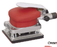
SI-3003 เครื่องขัดแบบสัน รุ่นเล็ก 70 X 100 มิล.