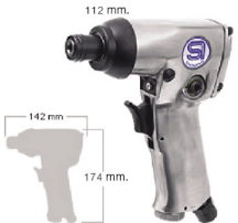
SI-1356D ไขควงลมขันสกรู เกลียวปลั๊อย 8 มม. รุ่นงานหนัก