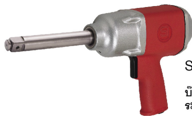
SI-1546 T บ็อกลม 3/4" เพลยาว 6" ระบบ Twin Hammer