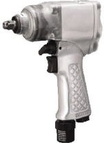
SI-1365 บ็อกลม 3/8" รุ่นปืนงานหนัก ระบบ Double Hammer