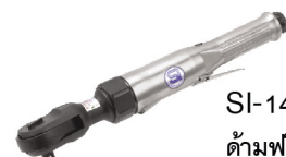
SI-1435 ต้ามฟรี 1/2" รุ่นงานหนัก ตัวใหญ่