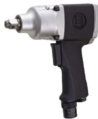
SI-1605 X บ็อกลม 1/2" รุ่นปืน ระบบ Pin Clutch