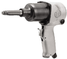
SI-1422 B (T) บ็อกลม 1/2" รุ่นปืนเพลยาว 4" ระบบ Single Hammer