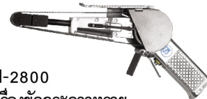
SI-2800 เครื่องขัดกระดาษทรายสายพาน 20 mm.