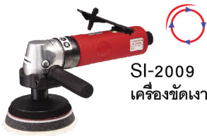
SI-2009 เครื่องขัดเงาสีรถยนต์ 3"