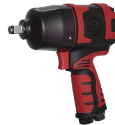
SI-1409 บ็อกลม 1/2" รุ่นปืนงานหนัก ระบบ Twin Hammer