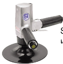
SI-2400 เครื่องขัดเงาสีรถยนต์ 7"