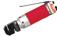
SI-4800 เครื่องพับและ ปั๊มเหล็กแผ่นลม Hydro Puncher