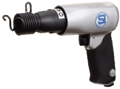
SI-4120 A สก็ด-ข่ารีเวทลม Middle Air Hammer