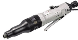
SI-1140 ไขควงลมขันสกรู เกลียวตลอด 4 มม.