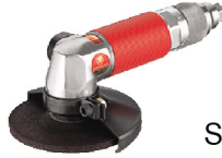
SI-2501 เครื่องขัดไฟเบอร์ 4" รุ่นเบา