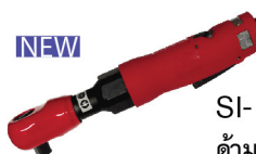
SI-1345 B ต้ามฟรี 1/2" หุ้มยาง รุ่นงานหนัก ลมออกหน้า