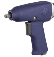
SI-1356 บ็อกลม 3/8" รุ่นปืน ระบบ Pin Clutch