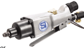
SI-1370 บ็อกลม 3/8" รุ่นตรงงานหนัก ระบบ Double Hammer