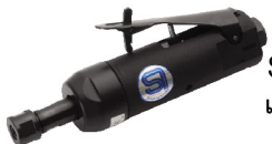
SI-2010 B เครื่องเจียรตัวใหญ่ (ลมออกหลัง)