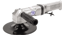
SI-2351 เครื่องขัดกระดาษทราย 7"