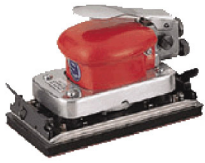
SI-3007 เครื่องขัดแบบสัน รุ่นงานหนัก 90 X 175 มิล.