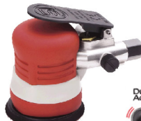
SI-3102 เครื่องขัดแบบเหวี่ยง รุ่นมือกด 3"