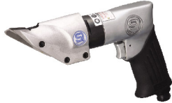
SI-4500 กรรไกรลมตัดเหล็กแผ่น 1.6 mm Sheet Metal Shear