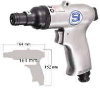
SI-1065 ไขควงลมขันสกรู เกลียวปลั๊อย 6 มม.