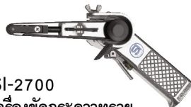
SI-2700 เครื่องขัดกระดาษทรายสายพาน 10 mm.