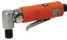
SI-2107 A เครื่องขัดกระดาษทราย 2"