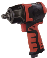
SI-1610 SR บ็อกลม 1/2" รุ่นปืนตัวเบา ระบบ Twin Hammer