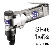
SI-4600 ไดร์ไวล์มตัด 1.6 มม. Air Nibbler