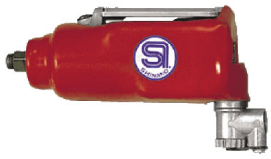
SI-1305 บ็อกลม 3/8" รุ่นตรง ระบบ Single Hammer