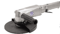
SI-2600 L เครื่องขัดไฟเบอร์ 7" แบบมือโกกด