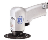
SI-2210 เครื่องขัดกระดาษทราย 3", 4"