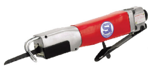
SI-4700 B จิ๊กซอว์ลม Air Saw