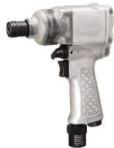
SI-1365D ไขควงลมขันสกรู เกลียวปลั๊อย 8-10 มม. รุ่นงานหนัก