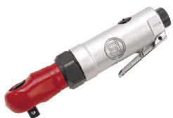
SI-1205 B ต้ามฟรี 3/8" รุ่นตัวสั้น