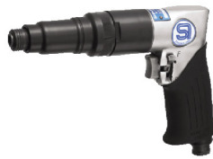
SI-1166-8A ไขควงลมขันสกรู เกลียวตลอด 6-8 มม.