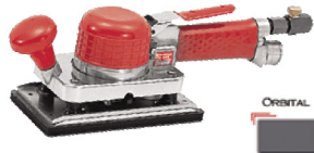
SI-3018 เครื่องขัดแบบสัน รุ่นมือกด มีถุงเก็บฝุ่น 90 X 175 มิล.