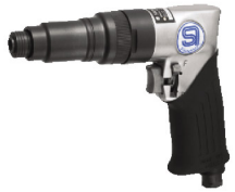
SI-1166A ไขควงลมขันสกรู เกลียวปลั๊อย 6 มม.