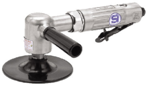
SI-2026 เครื่องขัดกระดาษทราย 5"