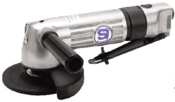
SI-2500 L เครื่องขัดไฟเบอร์ 4" แบบมือโกกด