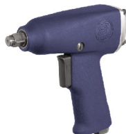
SI-1456 บ็อกลม 1/2" รุ่นปืนตัวเบา ระบบ Pin Clutch