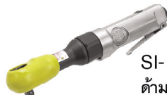
SI-1320 A ต้ามฟรี 3/8" รุ่นงานหนัก ลมออกหน้า