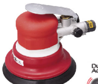
SI-3101 เครื่องขัดแบบเหวี่ยง รุ่นมือกด 5"