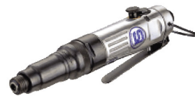
SI-1161 ไขควงลมขันสกรู เกลียวตลอด 5-6 มม.