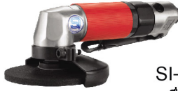
SI-2501 L เครื่องขัดไฟเบอร์ 4" แบบมือโกกด