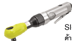
SI-1325 A ต้ามฟรี 1/2" รุ่นงานหนัก ลมออกหน้า