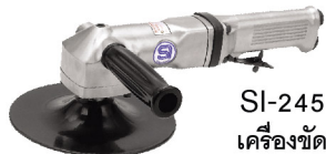
SI-2451 เครื่องขัดเงาสีรถยนต์ 7"