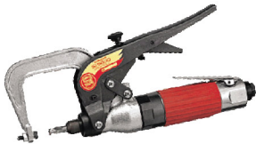
SI-5800 Spot Mill เครื่องเจาะรอยอาร์คต่อถังรถยนต์