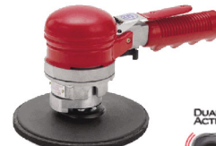
SI-3100 เครื่องขัดแบบเหวี่ยง รุ่นมือกด 6"